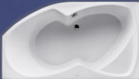
zobrazena levá varianta